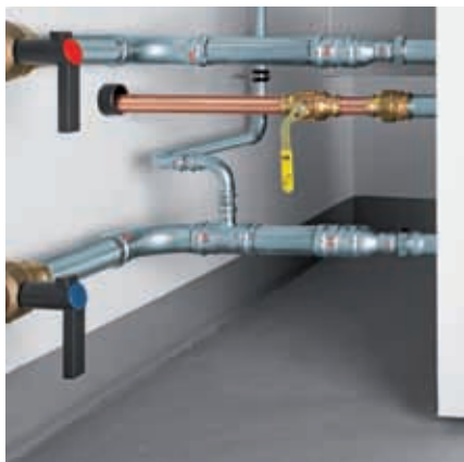
Podłączenie kotła grzejnego: dopływ i odpływ wykonany z Prestabo i zaworów kulowych Easytop. Podłączenie gazu z Profipress G.