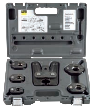
Do wymiarów 15 – 35 mm: szczęka przegubowa z opatentowaną funkcją przegubową i pięcioma pierścieniami zaciskowymi.