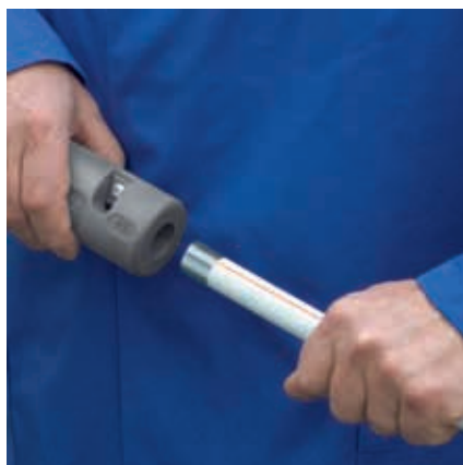
Urządzenie do usuwania białego płaszcza zewnętrznego z rur Prestabo.

Do pracy z Prestabo firma Viega opracowała narzędzia, które gwarantują maksymalny komfort i wysokie bezpieczeństwo: za pomocą urządzenia do usuwania płaszcza można zedrzeć biały płaszcz z polipropylenu z rur używanych do instalacji natynkowych. Za pomocą zaciskarek Viega uzyskać można pewne połączenie w przeciągu kilku sekund.