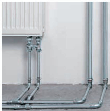
Prestabo to wszechstronność instalacji grzewczych.